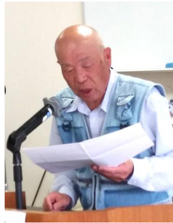
参加した白河の皆さん