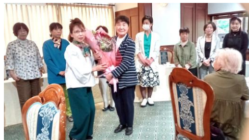
新旧交代のあいさつに立つ役員の皆さん