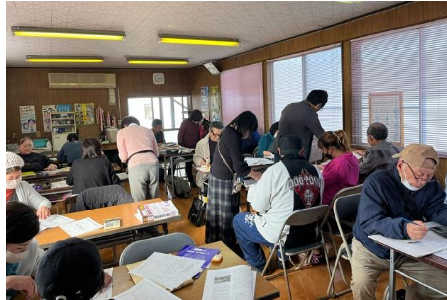
最後の書き上げ会に参加した会員

3月8日(金)、東北6県の民商代表が自民党の裏金問題について、公平で徹底した税務調査と必要な課税を求める要望書を仙台国税局に手渡しました。 国税局の回答は？ 「個別の案件には答えられない」との反応で、残念な回答でした。 要請の中で、 ● 納税者の納税意識を失わせる ● 納税をボイコットした などの納税者の声を紹介しましたが、反応はありませんでした。