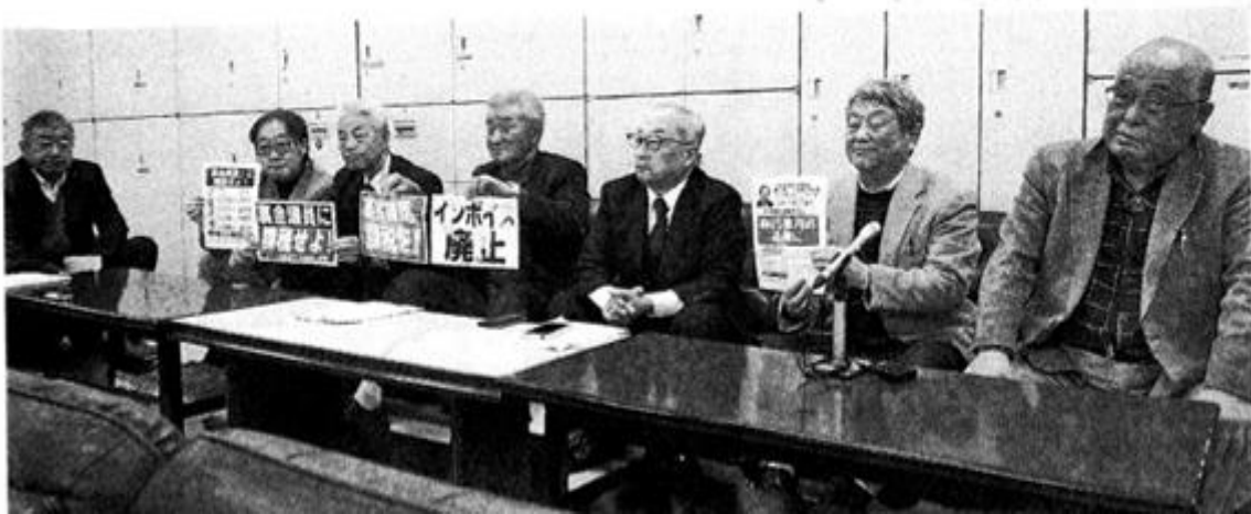
記者会見する東北6県の民商代表