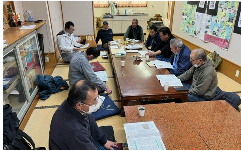
中島支部の書上げ会の様子

1月29日から始まった各支部の申告書上げ会が15日で前半が終了しました。これまでの各支部の申告書書き上げ会には146名が参加していますが、今年の書き上げ会では白河民商が重視している班を中心に集まっていた。 「税務行政のデジタル化推進によるあらゆる税務手続きが税務署に行かずにできる社会」についてなど学習を行ってからスタートしています。