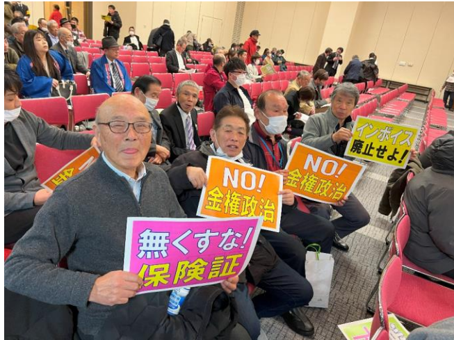
砂防会館での集会参加

2月7日(水)全中連が主催する中小業者決起大会が東京砂防会館で開催されました。白河民商からは3人が参加し、集会とデモ行進に参加しました。