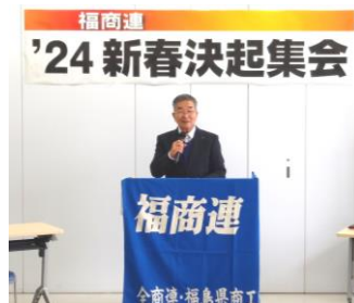
全商連：橋沢副会長