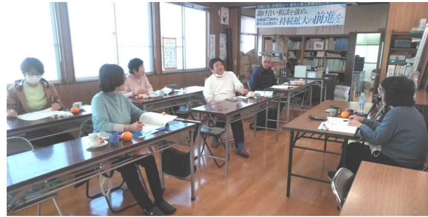
2回目学習会の様子

令和4年の確定申告(5年申告)を前に書き上げ班会のサポートをしていただける方の学習会が始まり、12月6日(水)に第2回目学習会を開催しました。2回目では所得控除を中心に「確定申告の手引き」を基に昨年の手引きと合わせて学習会を開催しました。あらためて学習することで記憶を呼び起こしながら各控除の名称や金額など確認しました。