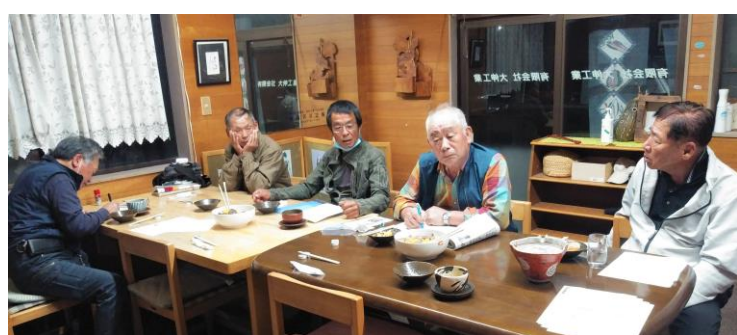
☞西郷I支部 ☜矢吹東支部