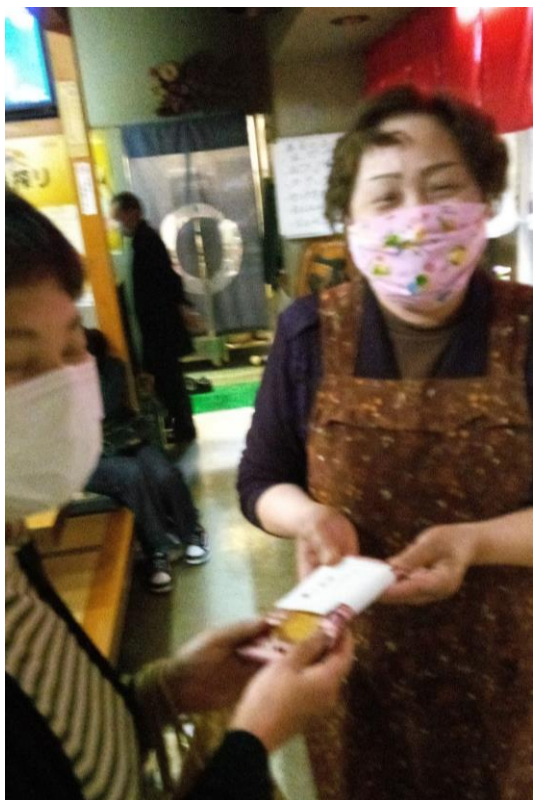
プレゼントを渡す婦人部役員さん(手前)と受け取る婦人部員さん

婦人部員の方からは、毎年心こもったプレゼントに喜びを感じると、部員の方には喜ばれています。