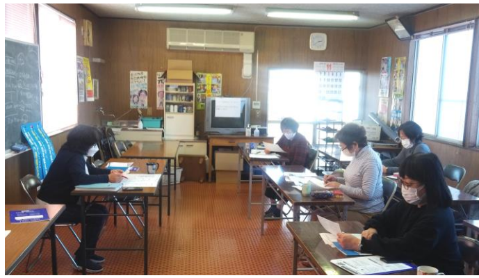
11月17日(水)の学習会の様子

11月10日・17日(水)民商会館にて、前回に引き続き税金相談員学習会を開催しました。 2回目は所得集計の仕方について、3回目は所得控除について学習をしました。令和3年の確定申告書上げ会まで学習していきます。