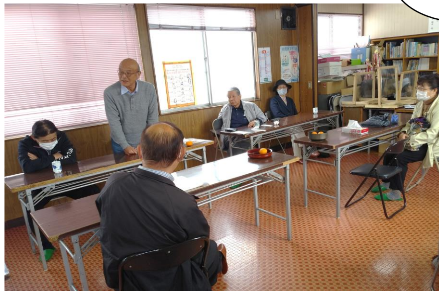
昼食をとった後、打合せする参加者役員のみなさん