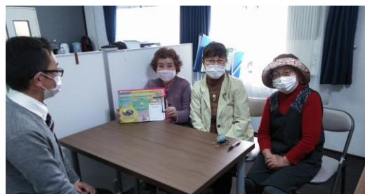
会員事務所へ訪問