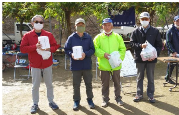
個人賞を獲得した皆さん