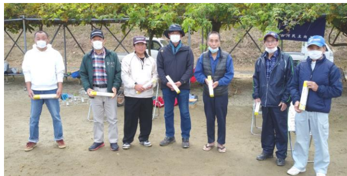
ホールインワンを達成した皆さん