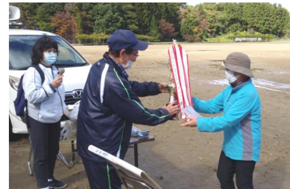
優勝トロフィーを受け取る 白河第5支部Aチーム