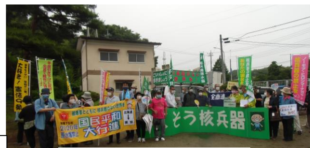
栃木県への引き継ぎの様子

「原水爆禁止世界大会」に向けて、北海道をスタートし福島県内中通りを通り、白河に7月4日(土)引き渡しを受けました。今年の平和行進は、新型コロナウイルスの影響で行進はしないで「スタンディング」でつなぎました。白河では25人の参加でスタンディングで市民にアピールしました。