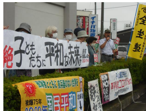
NTT前(白河駅前)でのスタンディング

「原水爆禁止世界大会」に向けて、北海道をスタートし福島県内中通りを通り、白河に7月4日(土)引き渡しを受けました。今年の平和行進は、新型コロナウイルスの影響で行進はしないで「スタンディング」でつなぎました。白河では25人の参加でスタンディングで市民にアピールしました。