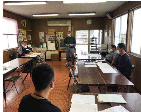
申請の説明を聞く会員さん

相談会は毎週水曜日に午後1時半・3時・4時の3回に分けて密を避ける形式です。めています。それぞれの時間帯で3〜4人の相談に乗って申請しています。ある会員さんは友人の会員2人が参加し、申請まで応援していました。