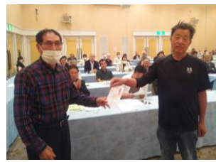
共済拡大 表郷支部