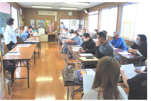
申請書記入会の様子

翌27日には白河民商会館にて申請書記入会が開催され、登録が必要な会員が集まって申請書を記入し税務署に提出しました。「自分は登録が必要なのだろうか？相談したい」と迷っている会員も多数来所し、新たに納税義務の発生することや取引先との関係性を確認しながらそれぞれ判断し、登録の要否を決めていました。