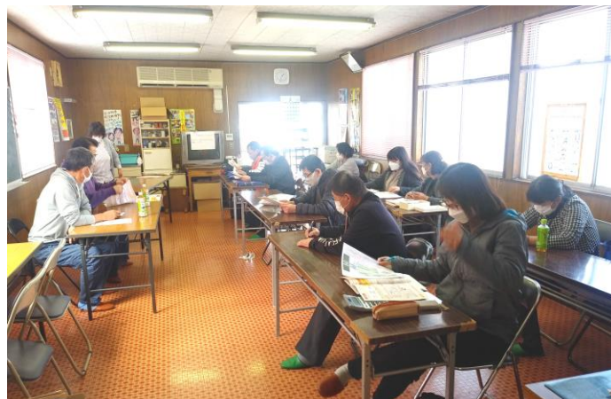
支援金申請終了した会員さんを講師に、説明学習会

第一回目の相談会を3月17日(木)午後1時30分～事業復活支援金の相談学習会をはじめに行い、県のまんえん防止の時短申請・県一時金と3回に分けての相談会を開催しました。当日は全体で15人の参加で申請に挑戦しました。