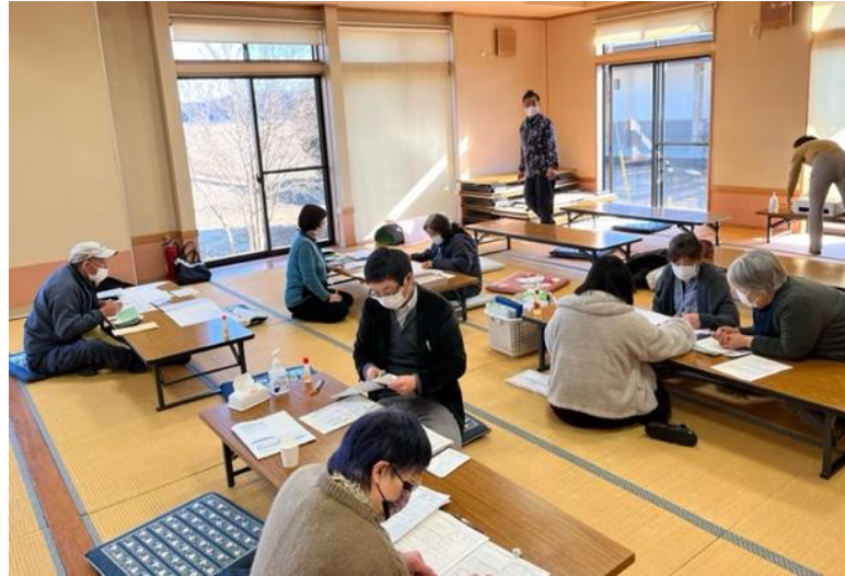
表郷支部の書き上げ会の様子

1月31日(月)から連日確定申告に向けて書き上げ会がスタートしました。コロナ感染が増えてはいますが、対策を取りながらの書き上げ会となっています。