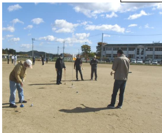
昨年のグラウンドゴルフ大会の様子 (西郷村)