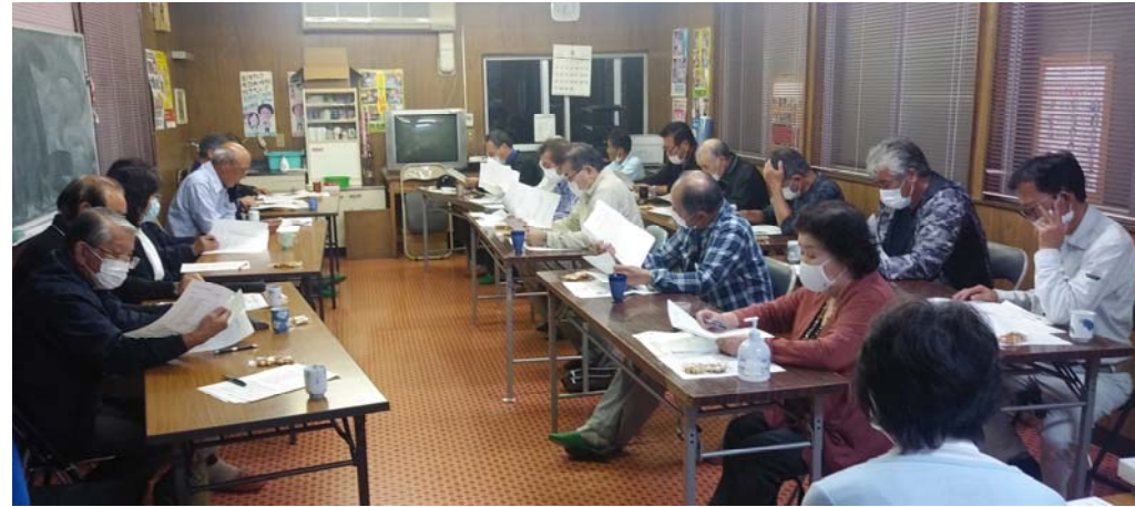
第1回常任理事会の様子