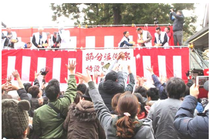
盛大に行われた豆まき

矢吹西支部役員会は1月17日(金)に割烹高久で開かれ6人が出席しました。申告計算会の日程を確認し、当日の役割分担を話し合いました。新春のつどいには支部で8人が参加する予定です。