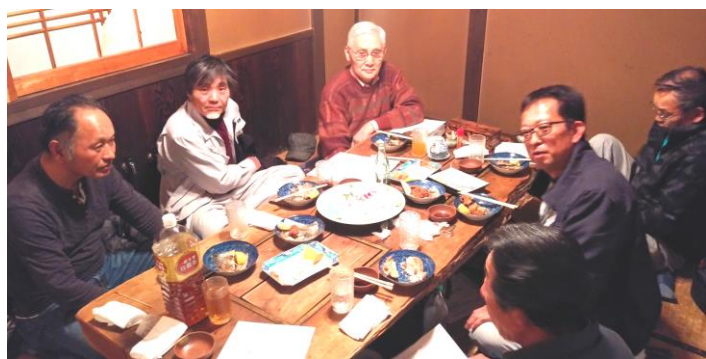
矢吹西支部役員会の様子