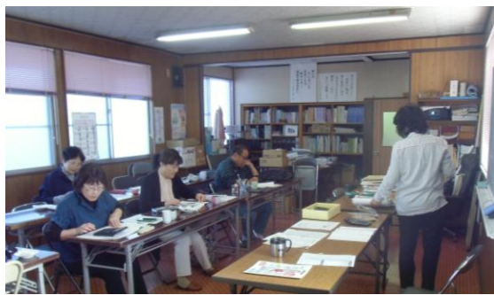
実際にノートを記入し計算をする相談員

2週間後の11月11日には第2回目が開かれ、減価償却についての学習を行なうことになっています。