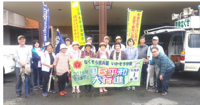
白河市役所まで行進した参加者の皆さん

8月7日から開催される原水爆禁止世界大会・広島、長崎大会をめざして、北海道礼文島から東京へ向かう国民平和大行進が連日行われています。福島県中通りを通過するコースでは、6月29日(土)に矢吹町から白河市を経て栃木県へ引き継がれる行進が行われました。