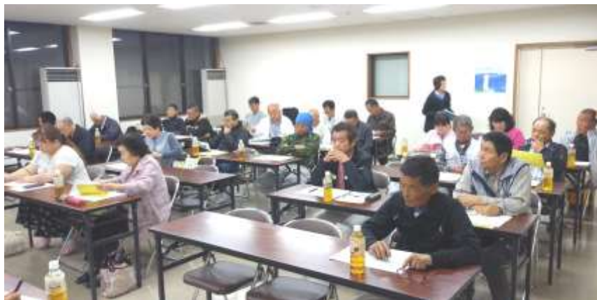
人材育成センター開かれた理事会

総会後、初めての理事会が5月21日（火）人材育成センターで開かれました。消費税の増税によりどんな悪影響が出るのかをみんなに広げて、何としても増税を中止させるために今、私たちの運動が求められています。今こそ民商の出番です。