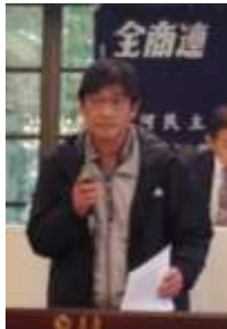
決算予算を報告する双石会計