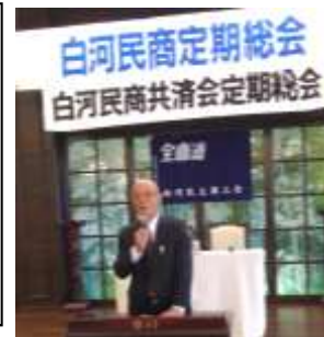
挨拶をする二宮会長

会員さんと役員の果たす役割は民商運動にとつてどんなに大きな力になっていくかを訴え、成長・発展を目指しましょうとあいさつをしました。