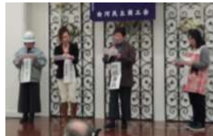
寸劇を披露する婦人部の皆さん