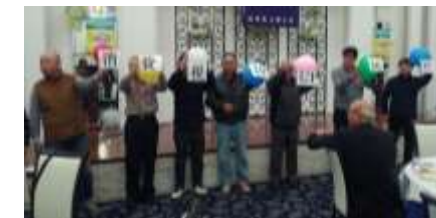
増税反対の風船パフォーマンス