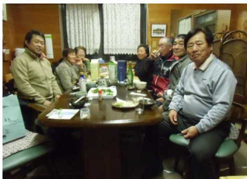
矢吹東支部役員会のようす

12月10日(木) 大伸工業蕎麦屋で矢吹東支部役員会が開かれ7人が参加しました。チャレンジカードを提出した会員と達成した会員を確認しあい、集めた署名をまとめたり、さらに集めるために頑張ろうと確認しました。美味しい新そばをいただきながらマインバー通知カードが届いた後の対応や、新春のつどいへの参加者話し合いました。また、未収会費のある会員や相談のあった会員について情報を交換して支部長と事務局で訪問することを決めました。