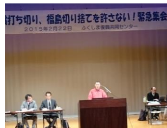
打ち切り、福島切り捨てを許さない! 緊急集会 2015年2月22日 ぶくしま復興共同センター

東電の原発事故による営業損害賠償の打ち切りを撤回させようと県内から300人が参加して、本宮市で緊急集会が開かれました。 この集会は福島復興共同センターの主催です。なぜ打ち切りなのか? 私たちは原発事故以前の水準に戻るまで賠償は当然だという思いです。